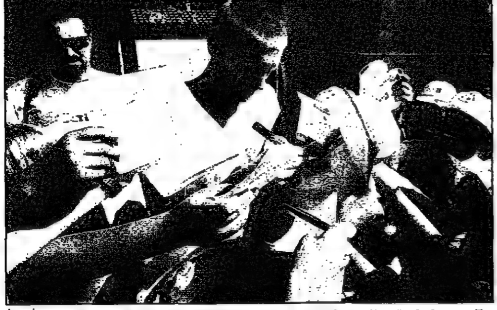
خروج هيتمان من بطولة دبي المفتوحة للتنس، وجاء خروج هيتمان بترتيب 7 و 6 / 4 امام الالبيان مارتن سينغ. وفي بقية مباريات نفس الدور فاز الارجنتيني هويانا جامي على الالبيان جيمس سيكوف 6 / 4 و 6 / 3، وتغلب الشويجي كرسيتيان رود على الاسباني فيليكس سانتياجا 6 / 2 و 6 / 0، وبيونير بالصوره بويوس بيكو بويو على الالبيان غرافات لذي وصوله دبي.

الذي سجل أكثر من 100 هدف في آخر خمسة مواسم له بدوري الدرجة الاولى في ايطاليا.